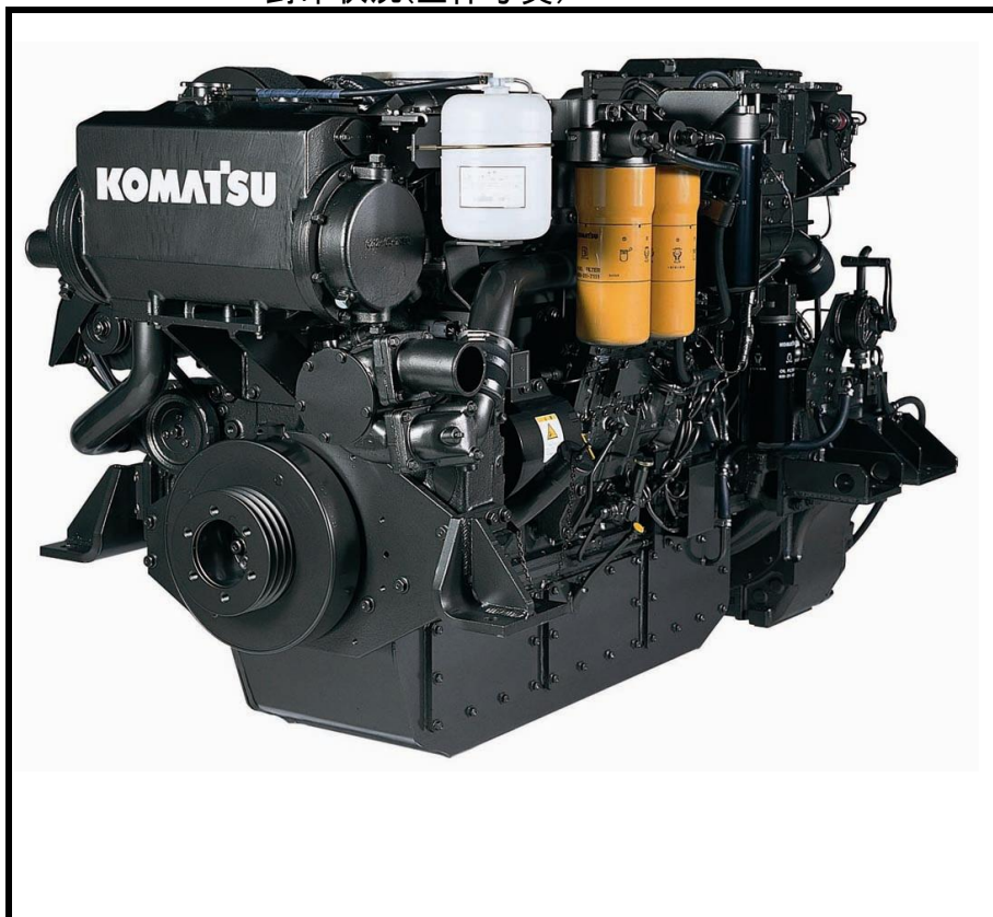
封印状況(全体写真)