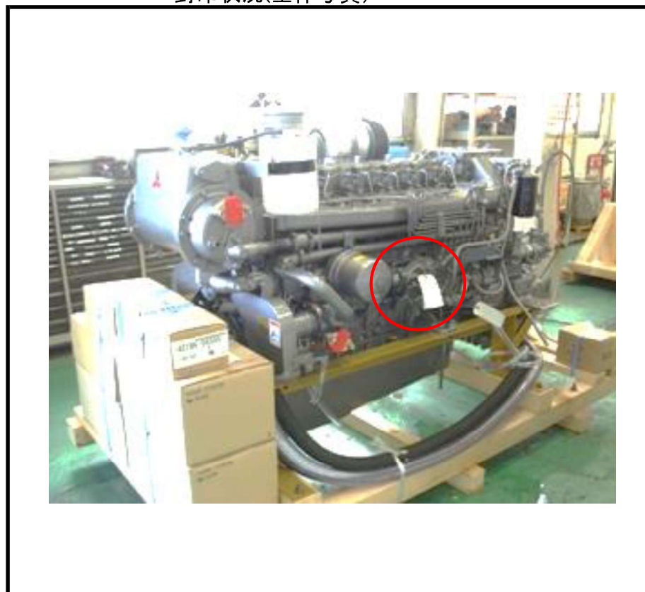
封印状況(制限装置カラー写真)