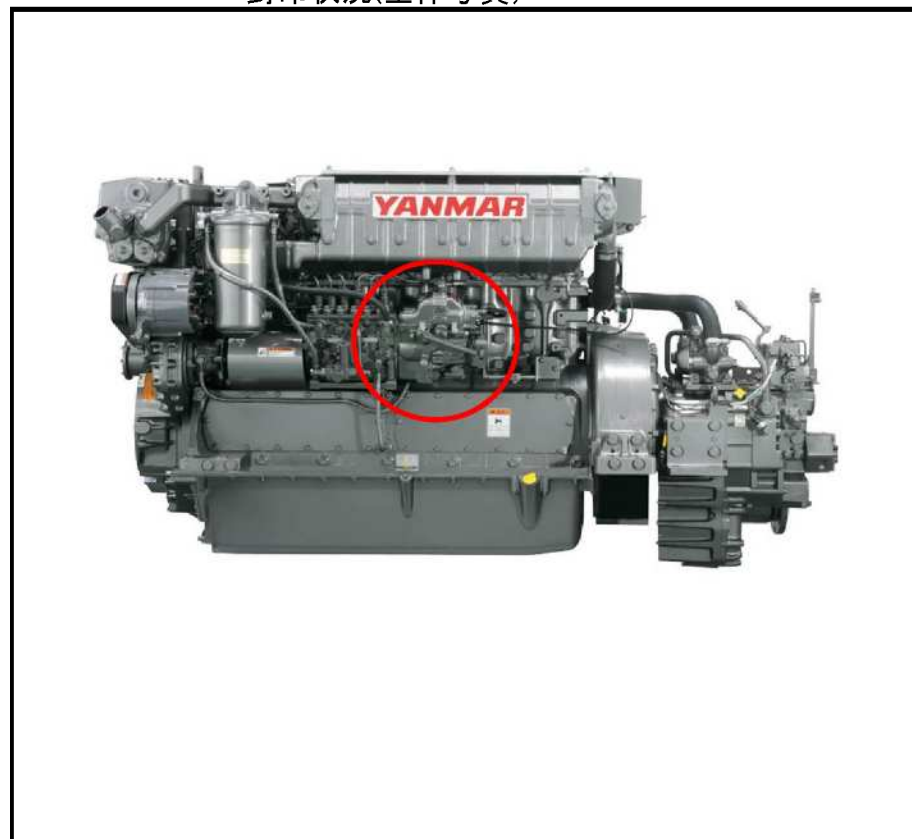
封印状況(全体写真)